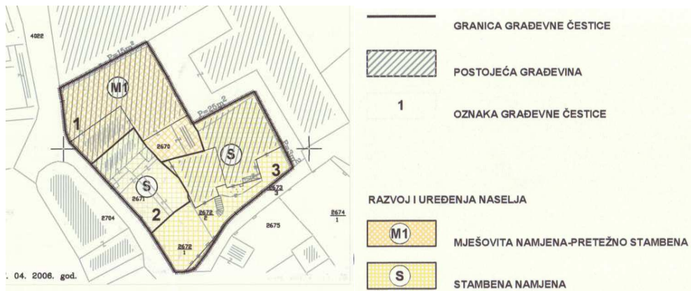
Izvod iz DPU-a „Galija“: kartografski prikaz br.1 “Detaljna namjena površina”