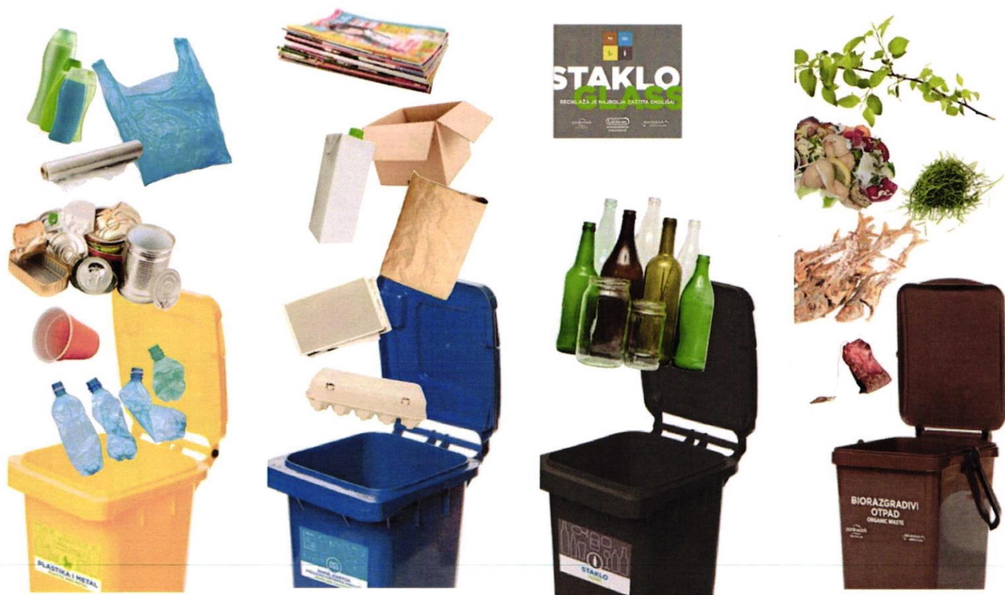
Slika 5. Posebno označeni spremnici za odvojeno sakupljanje otpada