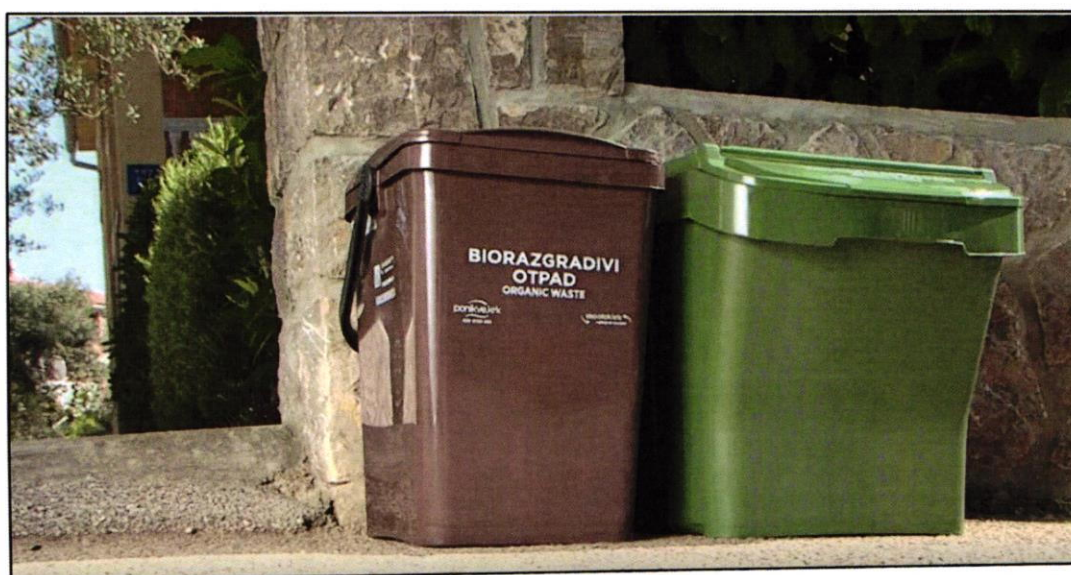
Slika 1: Set kanti u sustavu „od vrata do vrata“

U lipnju 2005. godine na otoku Krku uveden je ekološki zasnovan sustav zbrinjavanja komunalnoga otpada, popularno nazvan Eko otok Krk. Eko otok Krk predstavlja cjelovit model zbrinjavanja otpada, prvi takav u Republici Hrvatskoj, a omogućava zbrinjavanje svih vrsta otpada. Za funkcioniranje sustava na otoku Krku otpad koji nastaje u kućanstvu se odvojeno prikuplja u pet spremnika (spremnici za biootpad, papir, plastiku, staklo, ostalo) po modelu „od vrata do vrata“. Biorazgradivi otpad odlaže se u smeđu kantu, a preostali otpad u zelenu kantu.