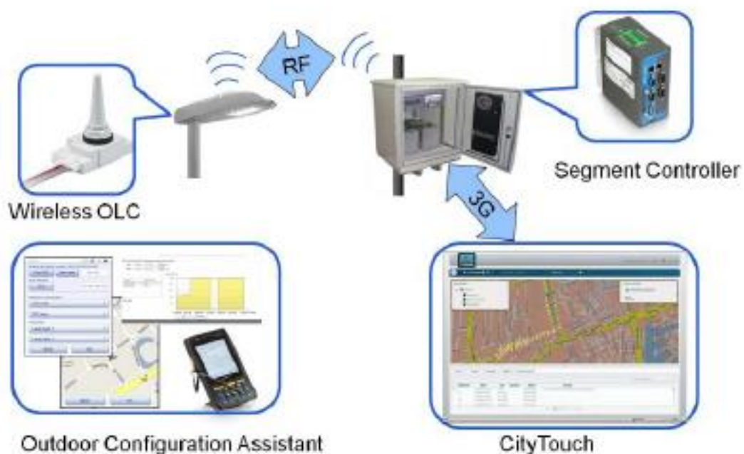
Slika 3. Arhitektura centralnog sustava nadzora i upravljanja (Starsense)

Kao što je prethodno opisano, komunikacija između SC-a i svjetiljki vrši se pomoću RF tehnologije. Time se omogućuje centralno upravljanje i nadzor nad velikim brojem rasvjetnih tijela ili grupa prema unaprijed određenom protokolu. Radna frekvencija RF komunikacije je slobodna za javnu uporabu i ne podliježe nikakvim dozvolama i odobrenjima u svim zemljama EU i većini drugih zemalja.