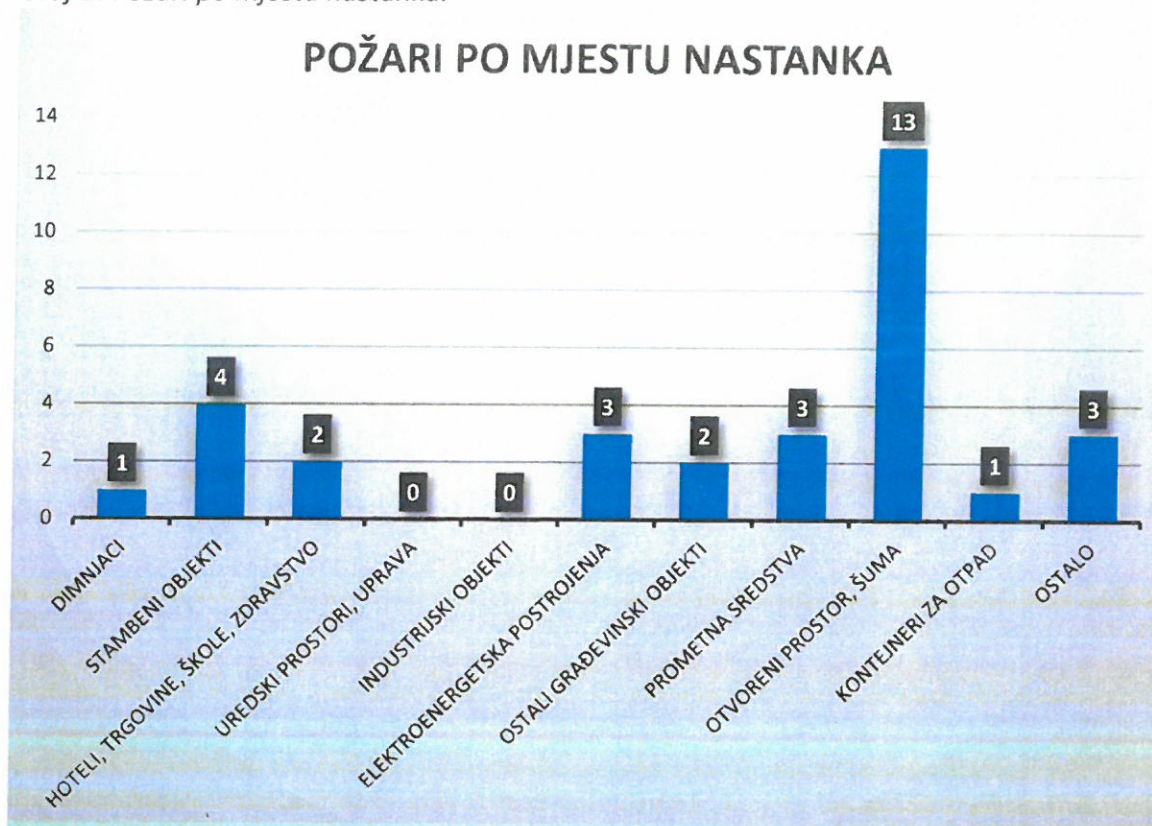
Graf 2. Požari po mjestu nastanka.

Iz predočenih podataka zaključujemo da je ovogodišnja protupožarna sezona itekako zadovoljavajuća sa visokih 82% manje izgorjene površine. Svakako treba spomenuti i povoljne meteorološke prilike koje su nas pratile ovog ljeta.