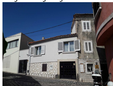
fotografija postojećeg kompleksa