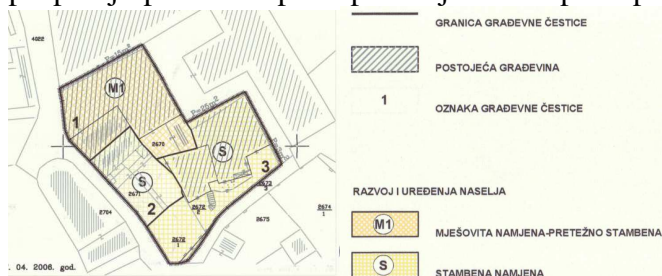
Izvod iz DPU-a „Galija“ kartografski prikaz br.1 “Detaljna namjena površina”

U očitovanju je navedeno da se za slučaj stavljanja izvan snage DPU "Galija" ne propisuje provedba postupka ocjene niti postupka strateške procjene utjecaja na okoliš.