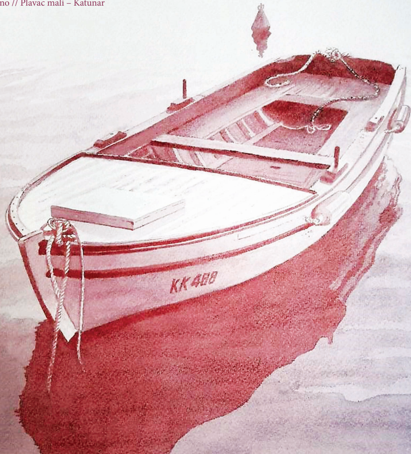
Barka // detalj // vinorel, tehnika slikanja vinom // Vino // Plavac mali – Katunar