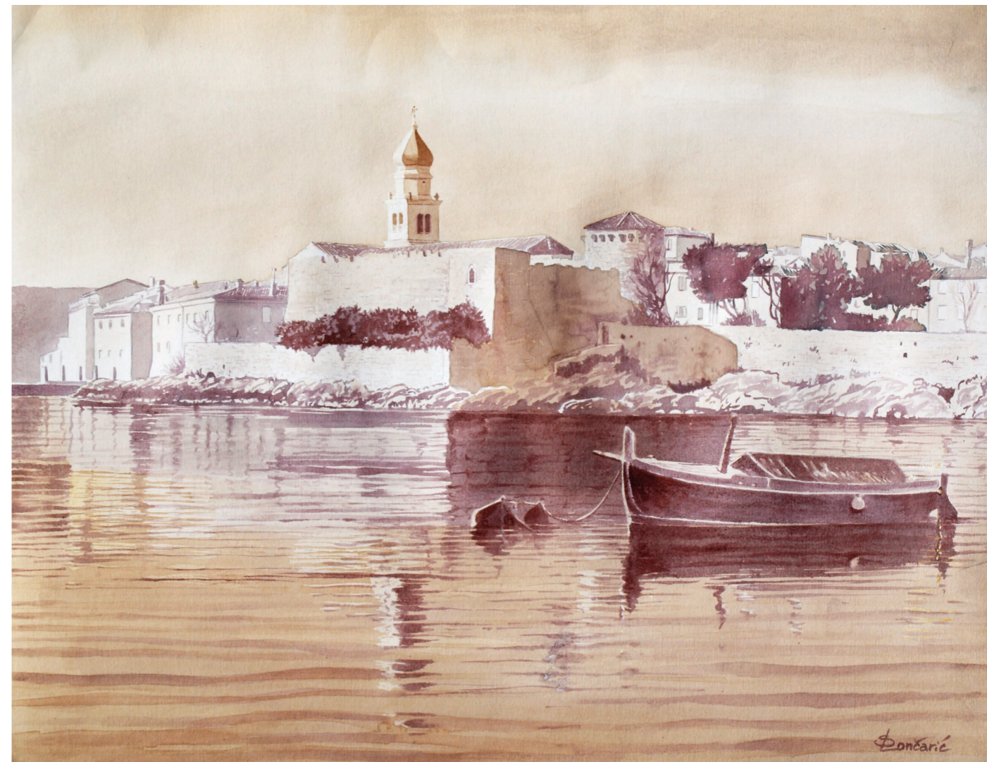
Panorama Krka II // vinorel, tehnika slikanja vinom Vino // Plavac mali – Katunar // 2015. – 2017.