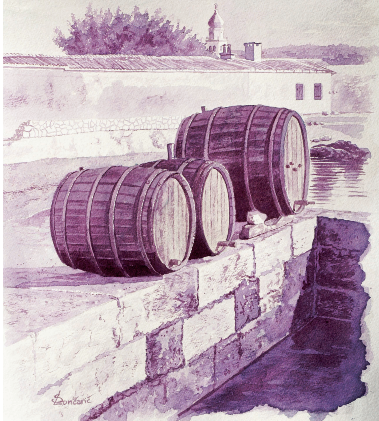
Bačve // vinorel, tehnika slikanja vinom Vino // Sansigot – Katunar