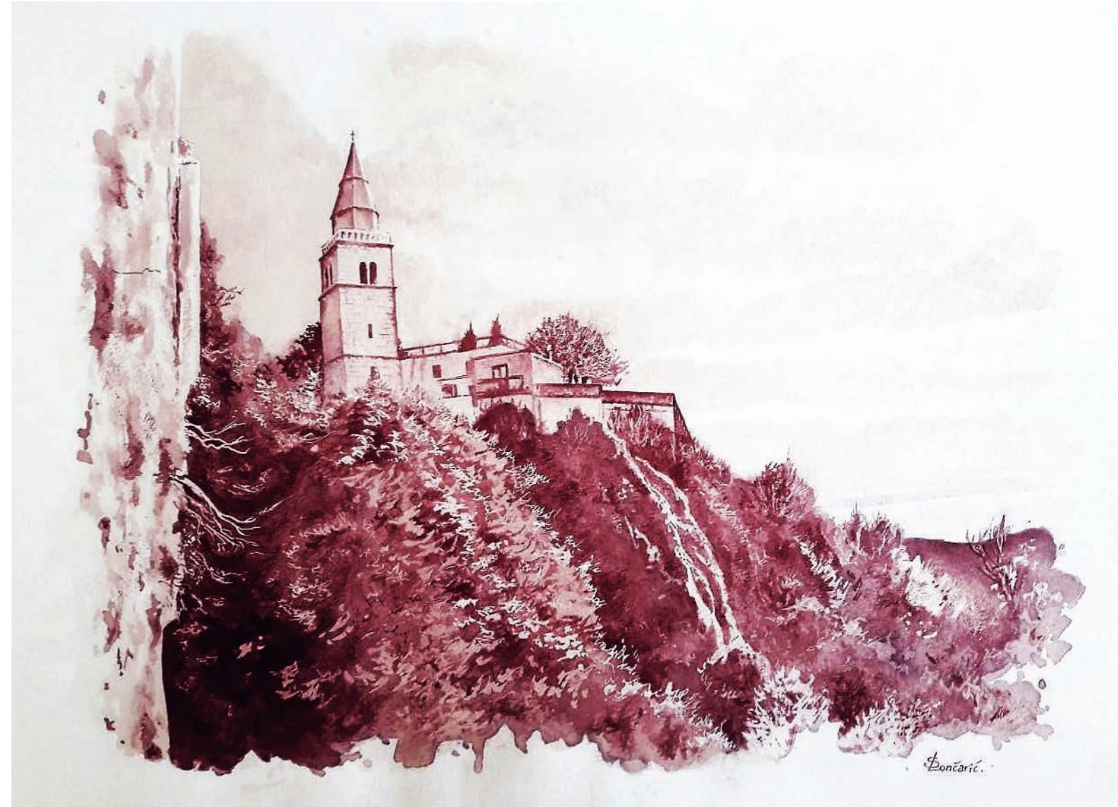
Dobrinj // vinorel, tehnika slikanja vinom VINO // Plavac mali – Katunar