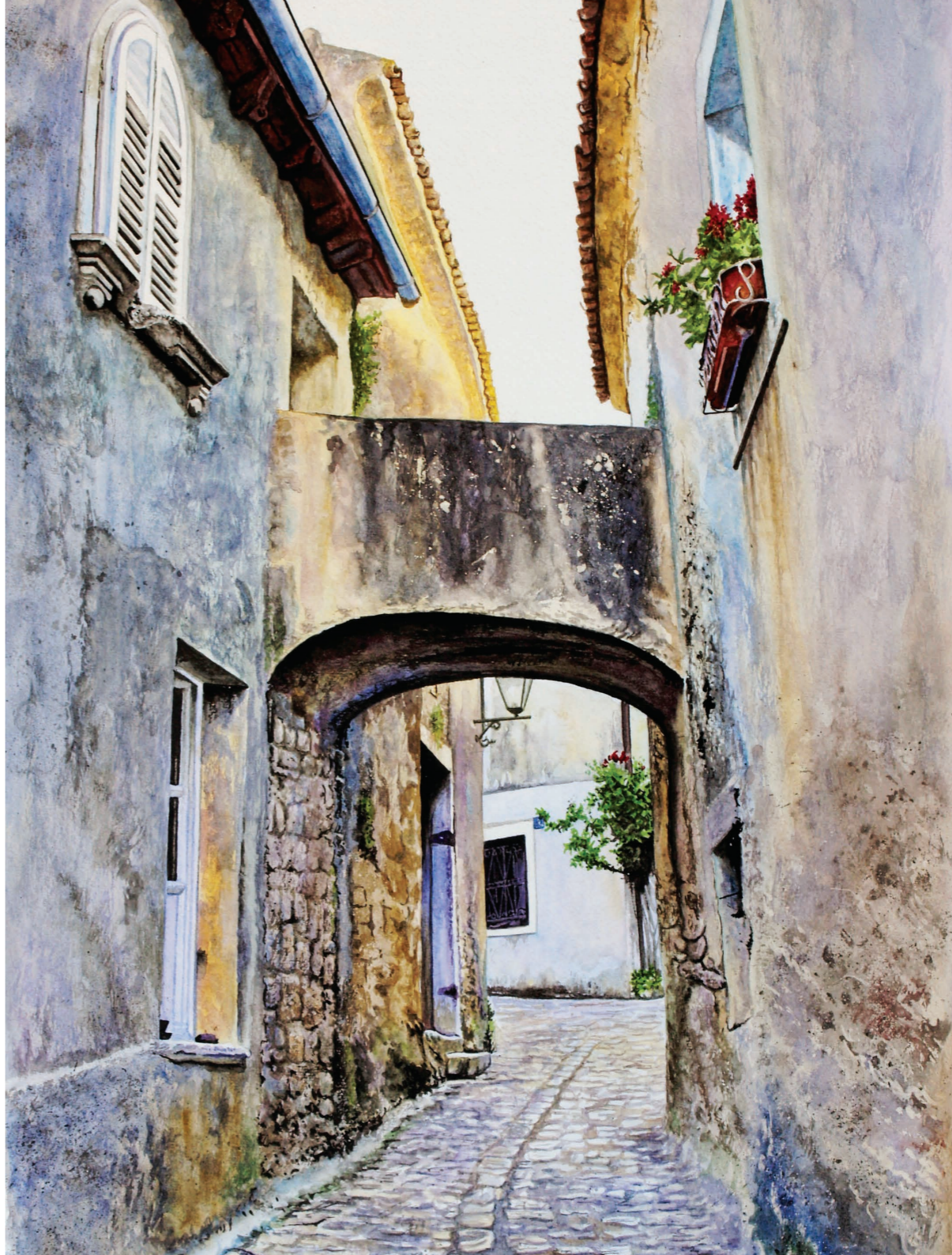
Ulica // akvarel