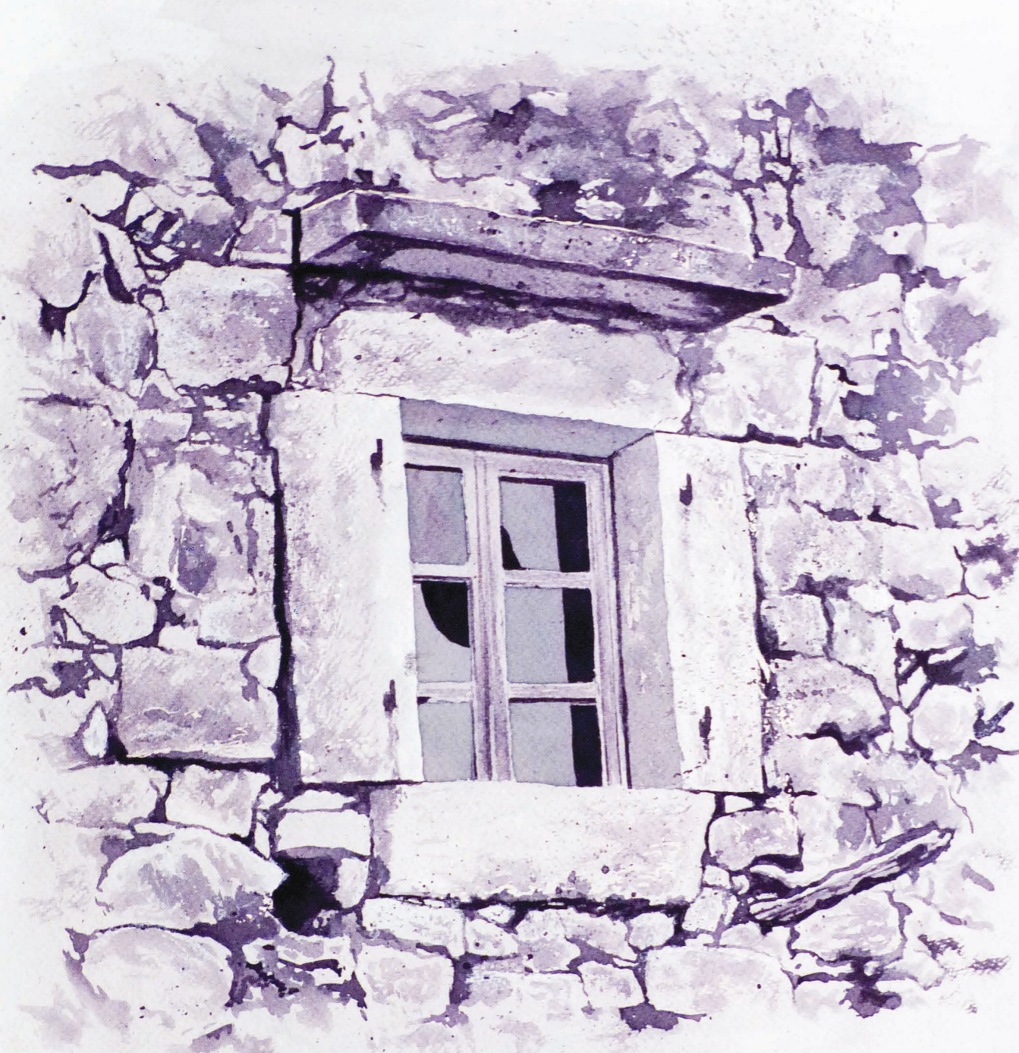
Puneštra // vinorel, tehnika slikanja vinom // Vino // Sansigot – Katunar