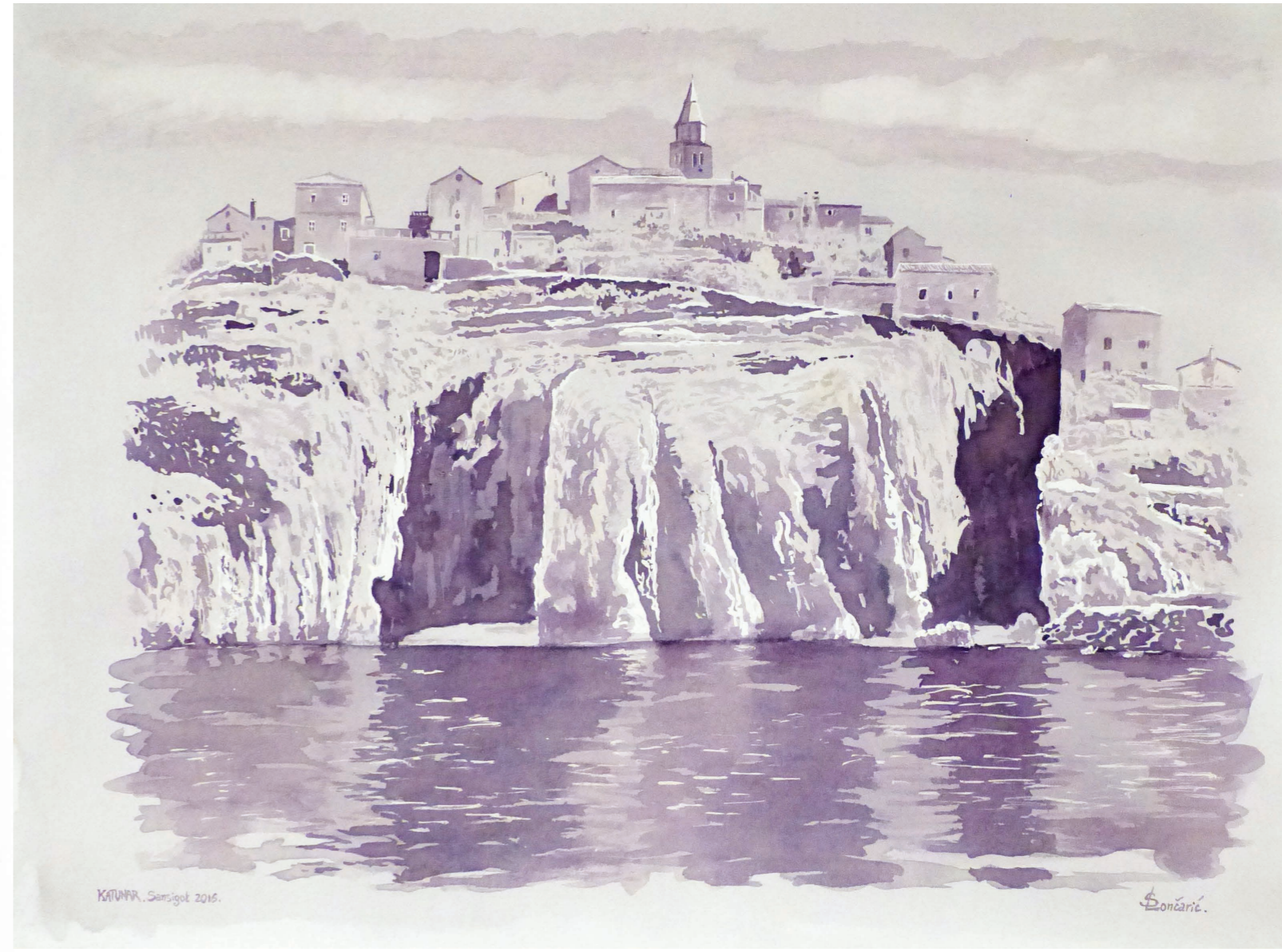
Stari Vrbnik // vinorel, tehnika slikanja vinom Vino // Sansigot – Katunar