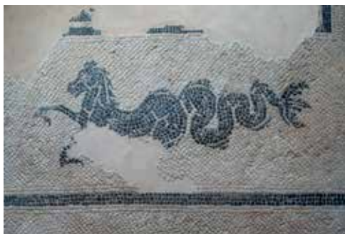
Pula, samostan i crkva sv. Franje, detalj mozaika s prikazom hipokampa, foto: HRZ

Informacije i novosti na: www.h-r-z.hr .