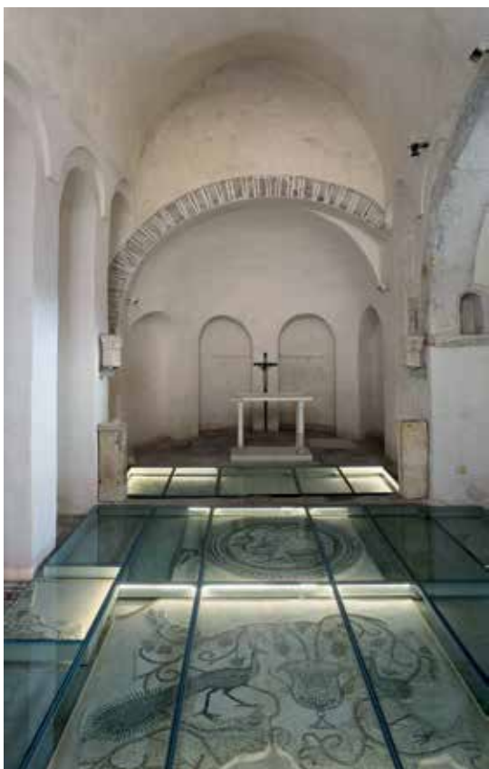
Crkva sv. Ivana u Starome Gradu na Hvaru

Nagradu za doprinos lokalnoj zajednici koja se dodjeljuje pojedincima ili udrugama civilnog društva za brigu oko očuvanja kulturne baštine ili za njezinu promidžbu ove je godine dobio Ekomuzej Batana iz Rovinja.