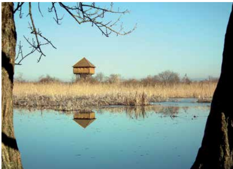
Posebni (ornitološki) rezervat „Krapje dol“, promatračnica za ptice

Posebni ornitološki rezervat „Krapje dol“ nalazi se u Parku prirode Lonjsko polje. Najstariji je riječni rukavac Save i zaštićen je 1963. godine. Uz rezervat se nalaze dvije promatračnice za ptice izgrađene od tradicionalnog materijala – hrastovine – i u povijesnom stilu nekadašnjih „čardaka“, koji su u vrijeme Vojne krajine bili uz rijeku Savu i služili za čuvanje granice između Austro-Ugarske Monarhije i Otomanskog Carstva. Cijela staza koja spaja sela Krapje i Drenov Bok dugačka je 4300 m, a prolazi kroz tradicionalni krajobraz mozaičnih poljoprivrednih oranica, livada, pašnjaka i prirodnih živica.