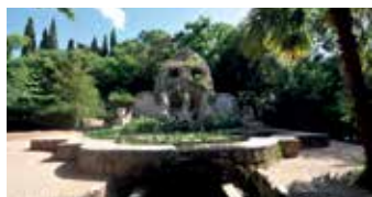
Trsteno, ljetnikovac Gučetić, Neptunova fontana u perivoju, foto: HRZ

ORGANIZATORI: Hrvatski restauratorski zavod, Muzej Mimara