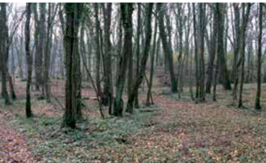
Kulturni krajolik u kojem prevladava priroda

Preporuka: prikladna odjeća i obuća, u slučaju kiše i zaštita od kiše, trajanje obilaska cca 4 sata.