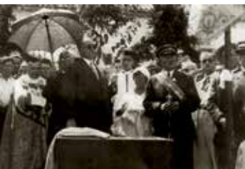
Svečanosti na otoku Šolti 1932. godine. Postavljanje spomen-ploče posvećene maršalu Józefu Piłsudskom te donošenje brojnih darova – poljskih simbola, koji su do danas prisutni na otoku Šolti.

20. 10 – 28. 10. 2017., Etnografski muzej Split, Ul. Iza Vestibula 4, Split ORGANIZATORI: Poljska kulturna udruga „POLONEZ”, Etnografski muzej Split