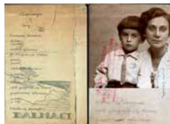
Poljski pjesnik Krzysztof Kamil Baczyński autor je pjesme „Dalmacija“. Boravio je na otoku 1937. i 1938. godine, a napisao je više pjesama o Dalmaciji.

Druga kuća koju su Poljaci kupili na Šolti nalazila se u Rogaču i nazvana je „Zofiówka“, a zadruga „Poljski dom na Jadranu“ postavila je na kuću 1932. godine spomen-ploču posvećenu poljskom maršalu Józefu Piłsudskom, koja se sada nalazi u crkvi u Rogaču. U to je vrijeme iz Poljske, iz Vilnusa, dostavljena kopija slavne slike Majke Božje Ostrobramske kao i dvije slike za župnu crkvu u Grohotama: slika Sv. Kinge (dar samostana klarisa u Nowom Sączu) i slika Sv. Salome (dar Samostana sv. Andrije u Krakowu).