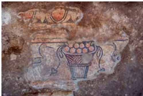
Pula, crkva sv. Marije Formoze, detalj mozaika s prikazom košare s voćem i pticama močvaricama, foto: HRZ