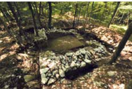
Mlake - Lipice, ostaci obrambenih struktura, foto: HRZ

Više informacija dostupno je na www.h-r-z.hr .