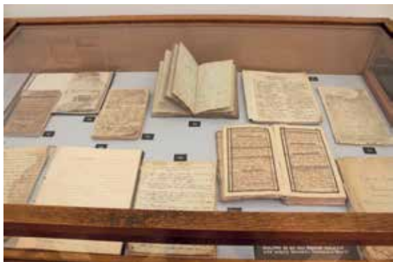
Ljekaruše na izložbi

Zbirka narodne medicine Hrvatskog muzeja medicine i farmacije HAZU upisana je u Registar pokretnih kulturnih dobara RH 2016. godine. Sačuvana je u Odsjeku za povijest medicinskih znanosti HAZU, a najvećim je dijelom naslijeđena od Muzeja za povijest zdravstva (HLZ, 1944.). Zbirka sadrži pučke instrumente, narodne lijekove, apotropijske predmete, votive, zapise, fotografije, ljekaruše i drugo iz razdoblja od 18. do 20. stoljeća, uglavnom s područja kontinentalne Hrvatske te iz Bosne i Hercegovine. Osobita vrijednost zbirke sastoji se u činjenici da je njezino podrijetlo, povijest i prvu izložbenu prezentaciju bilo moguće precizno rekonstruirati na osnovi arhivskog gradiva. Farmaceutsko-biokemijski fakultet Sveučilišta u Zagrebu uz izložbu je priredio prigodna predavanja na temu fitofarmacije, tradicionalnih biljnih lijekova i njihove toksičnosti.