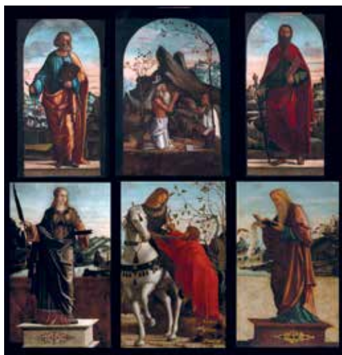
Zadar, katedrala sv. Stošije, poliptih sv. Martina

Predavanje će biti posvećeno burnoj prošlosti poliptiha sv. Martina, što ga je od velikog renesansnog slikara Vittorea Carpaccia naručio zadarski kanonik Martin Mladošić potkraj 15. stoljeća. Devastacija poliptiha počela je još u 18. stoljeću, kad su slike skinute s oltara pri obnovi crkve sv. Stošije. Tijekom vremena izvedeno je na poliptihu više intervencija nepoznatih autora: od mijenjanja dimenzija slika do potpunog preslikavanja i neadekvatnog čišćenja. Oštećenja velikih razmjera nastala su nakon Drugog svjetskog rata, kad su umjetnine iz vlažnog skloništa naglo premještene u izrazito suh potkrovni prostor, pa im je prijetila opasnost od potpunog uništenja. Od početka 20. stoljeća izvedeno je više konzervatorsko-restauratorskih zahvata, posljednji od 2003. do 2015. godine. Predavanjem će se predstaviti rezultati restauratorskih istraživanja i posljednjeg zahvata na poliptihu te proučavanja pisanih i fotografskih podataka o prethodnim intervencijama.