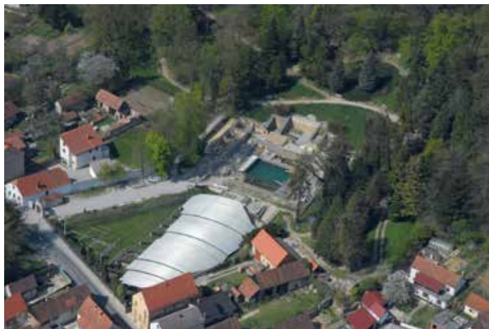
Kompleks rimske arhitekture u gradskom parku u Varaždinskim Toplicama, 1. – 4. st.

Dodatne informacije: Arheološki muzej u Zagrebu, Trg N. Š. Zrinskog 19, Zagreb, www.amz.hr .