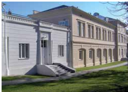
Rimske kupke i Dependence