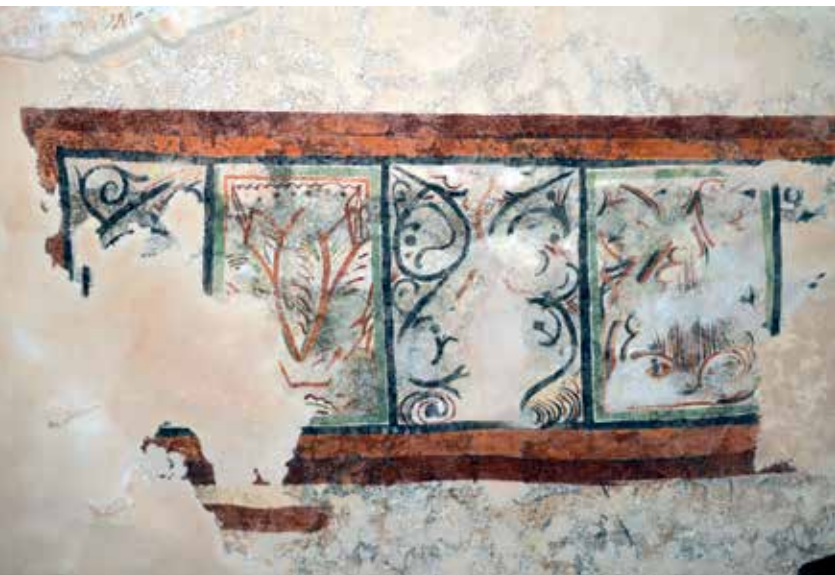
Ostatci srednjovjekovne freske, Samostan sv. Marije, Glavotok

Od 2015. godine provode se opsežni radovi na obnovi crkve i dijela samostana. Tijekom zaštitnih i istovremeno provedenih istražnih radova došlo je do značajnih nalaza. Otkriće srednjovjekovnih fresaka, odnosno sjevernog zida prvotne crkve, te rezultati građevinskih sondiranja i arheoloških istraživanja stvorili su mogućnosti za novo čitanje građevnog razvoja crkve i samostanskog kompleksa, bitno drugačije od dosadašnjeg.