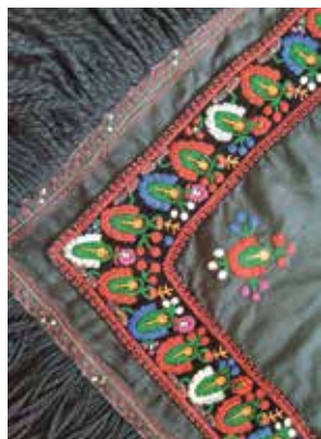
Čičak i poljsko cvijeće, narodna nošnja Koprivničkog Ivanca s početka 20. st.

15. 10. 2017., u 16:00 sati, Osnovna škola Koprivnički Ivanec, Koprivnička ulica 27, Koprivnički Ivanec ORGANIZATOR: Društvo izvornog folklor Koprivnički Ivanec