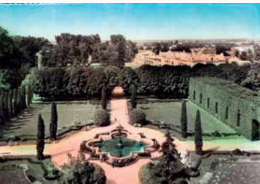
Vrt ispred Kursalona, povijesna fotografija

1869. izveo je bušenje arteškog bunara do dubine od 234 metra, na kojoj se nalazi pitka mineralna voda temperature 64 °C, uz koji je podignut paviljon Izvor s vodom za piće. Blatne i Kamene kupke izgrađene su 1870., a hotel Garni (Kurhotel) i Dependence 1872. godine. Lipičke toplice već potkraj 19. stoljeća postaju glasovito europsko lječilište, a 1885. prelaze u vlasništvo peštanskih liječnika Deutscha i Schwimera ,